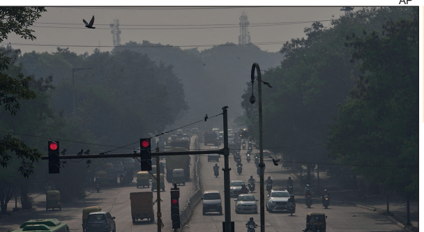
36 प्रतिशत लोगों ने सीधे कहा कि चार या इससे अधिक लोग प्रदूषण की वजह से बीते चार हफ्तों से परेशानियां झेल रहे हैं

पल्यूशन को लेकर बढ़ती चिंता के बीच रविवार को बड़ी संख्या में लोग इंडिया गेट पर जुटे और सरकार से प्रभावी कदम उठाने की मांग की। बीते कुछ सालों से सरकार को ओर से GRAP, ऑड-इवन, निर्माण कार्यों पर रोक और पटाखों पर बैन जैसे उपाय लागू किए जा रहे हैं। इसी बीच लोकल सर्कल्स की ओर से किए गए एक ताजा सर्वे में पता चला है कि लोगों को इन उपायों से खास भरोसा नहीं है। लोकल सर्कल्स ने दिल्ली-एनसीआर यानी दिल्ली, गुरुग्राम, नोएडा, फरीदाबाद और गाजियाबाद में रहने वाले लोगों से पूछा कि पिछले चार हफ्तों में उन्हें पल्यूशन का कितना असर झेलना पड़ा है। इस सर्वे में कुल 53 हजार जवाब मिले। इस सर्वे में पूछा गया कि बीते चार हफ्तों में