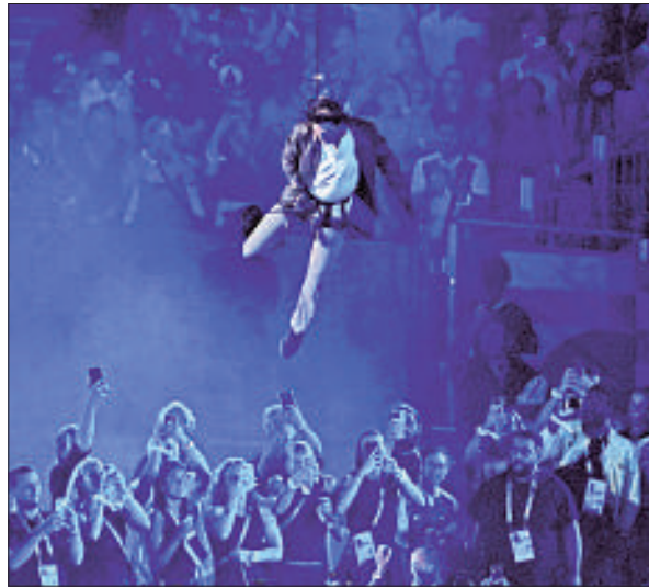
समापन समारोह में कार्यक्रम प्रस्तुत करते अभिनेता टाम कूज।

गया, जिन्होंने उसे वेनिस बीच पर स्केटबोर्डिंग लीजेंड जैगर ईटन को सौंपा।